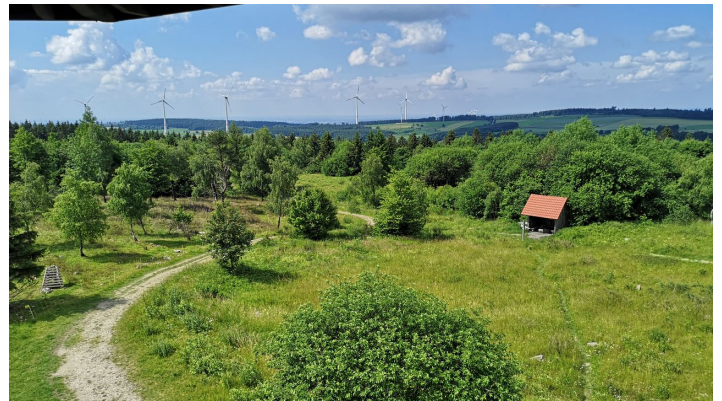
Blick vom Eggeturm