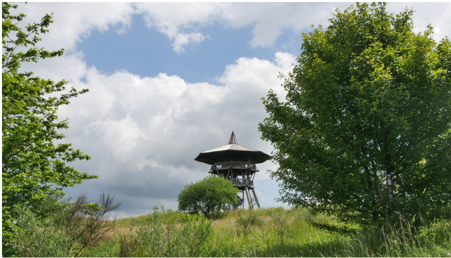
Der Eggeturm am Preußischen Velmerstot