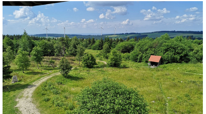
Blick vom Eggeturm