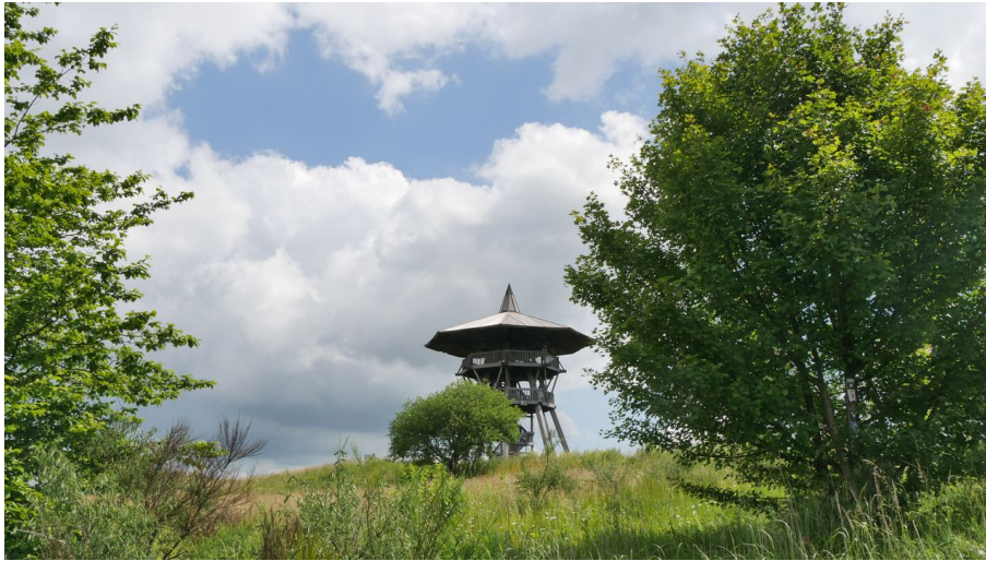
Der Eggeturm am Preußischen Velmerstot