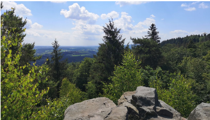
Lippische Velmerstot