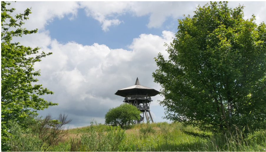
Der Eggeturm am Preußischen Velmerstot