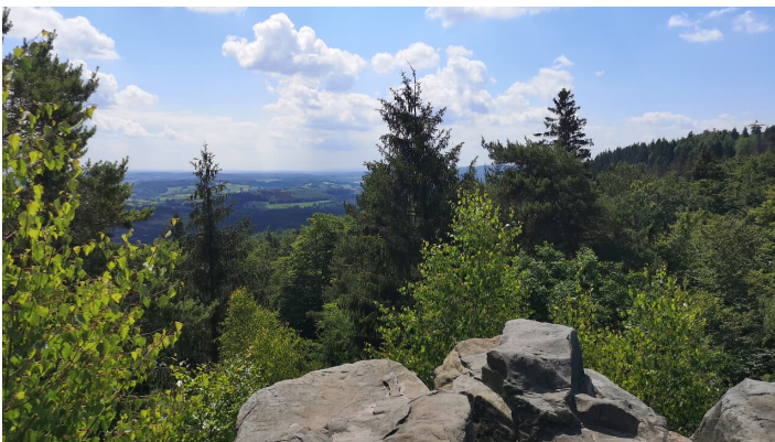
Lippische Velmerstot