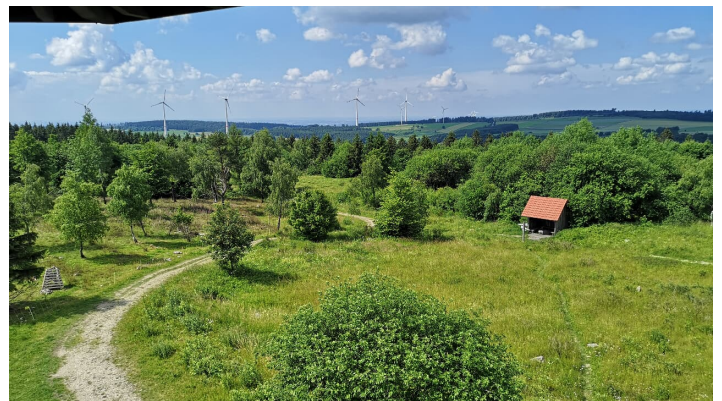
Blick vom Eggeturm