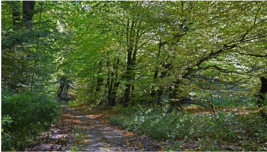
Waldweg - © Naturpark Teutoburger Wald/Eggegebirge