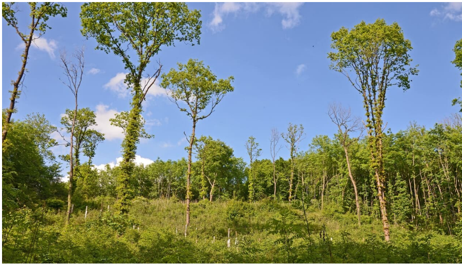
Schöne Lichtung im Wald