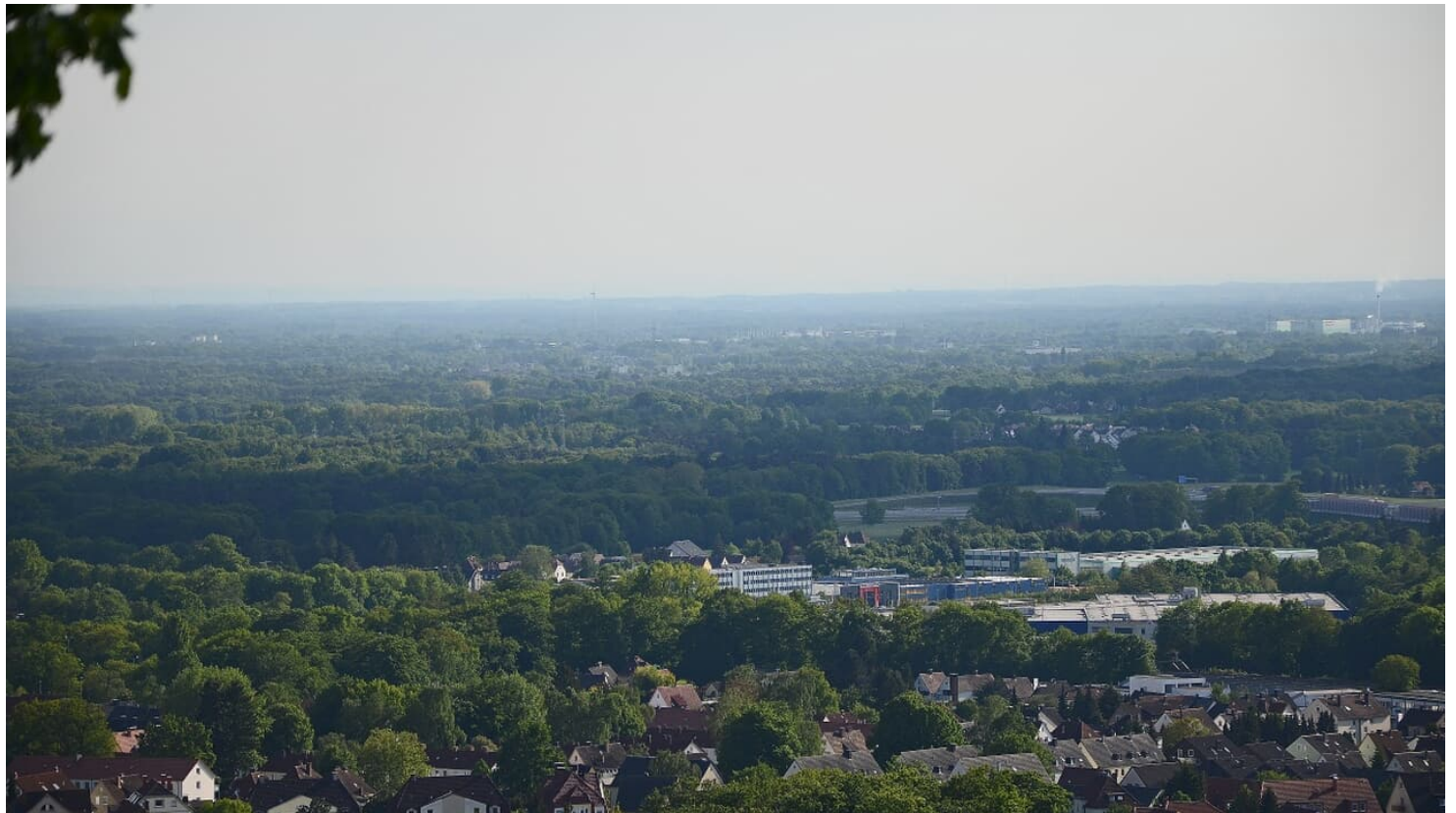
Blick über Bielefeld