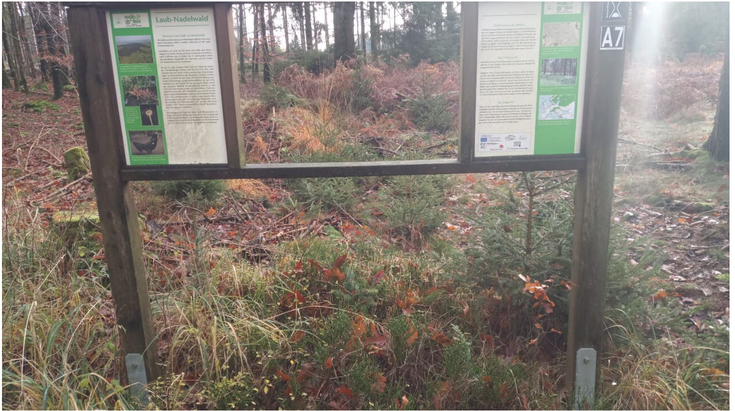
Infofenster NaturZeitReise