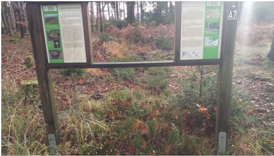
Infofenster NaturZeitReise - © Naturpark Teutoburger Wald / Eggegebirge