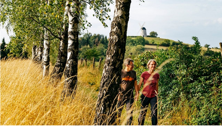
An den Fischeichen