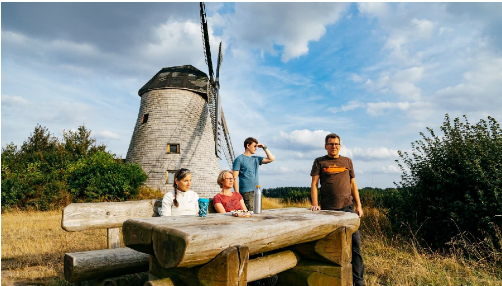
Rastplatz an der Windmühle Bavenhausen