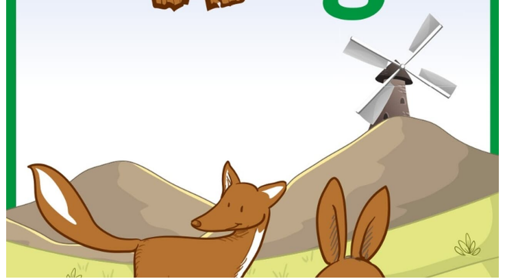
Logo Waldfreundeweg