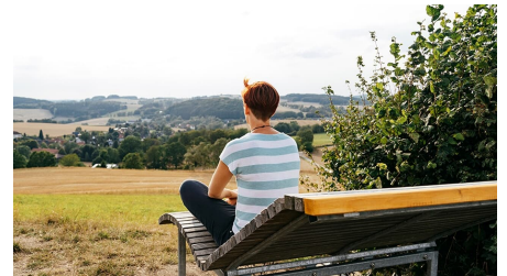
Ausblick von Landschaftsliege an Windmühle