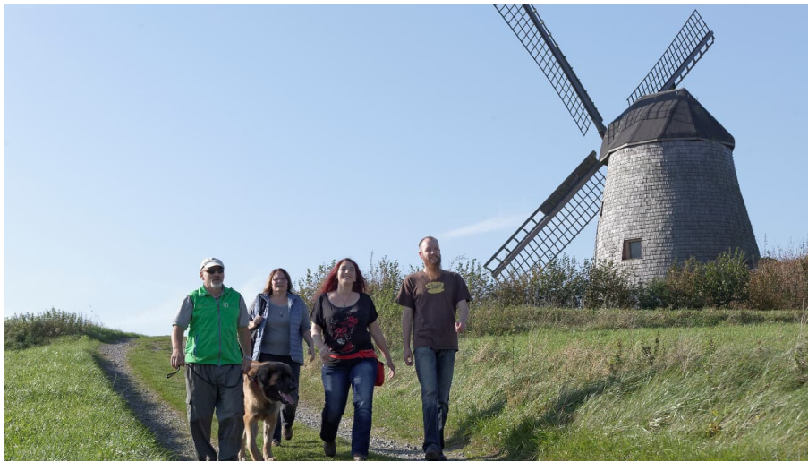
Windmühle Bavenhausen