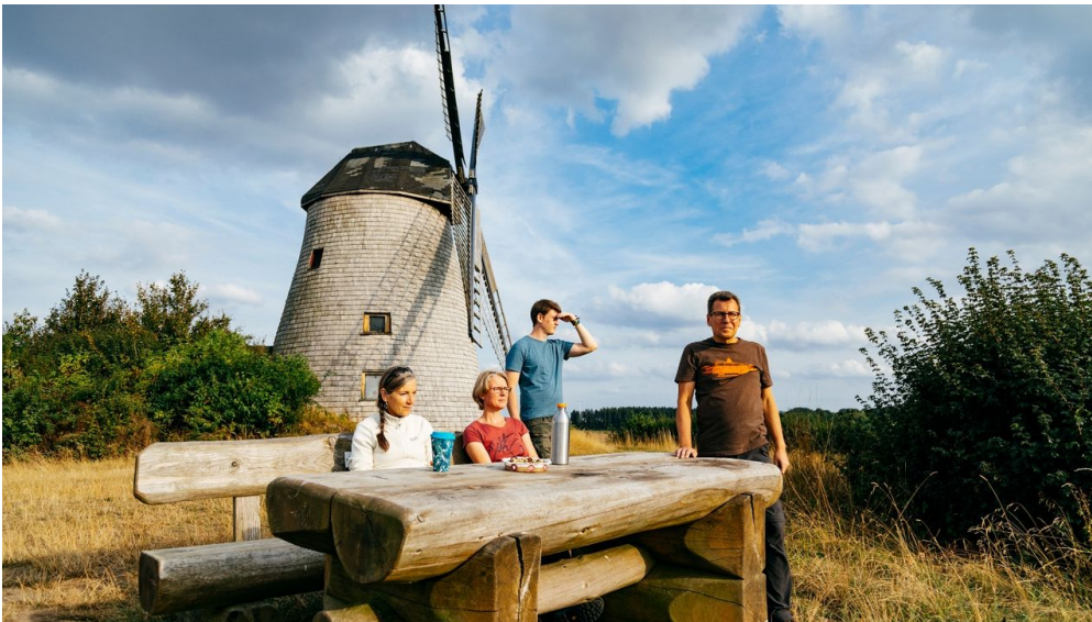
Rastplatz an der Windmühle Bavenhausen