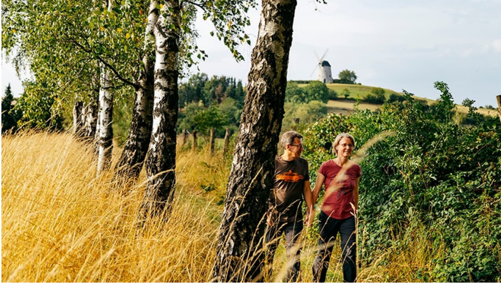
An den Fischeichen