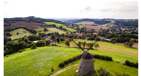
Luftaufnahme Windmühle Bavenhausen