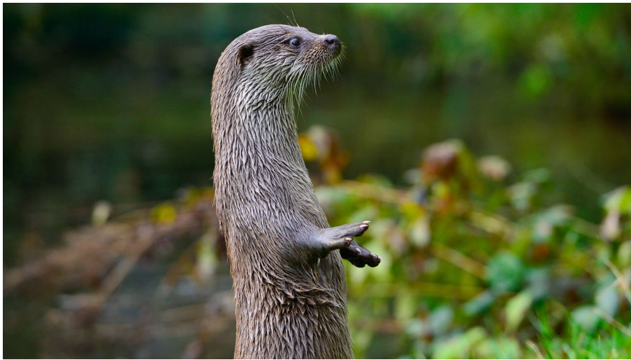
Otter im Otter-Zentrum