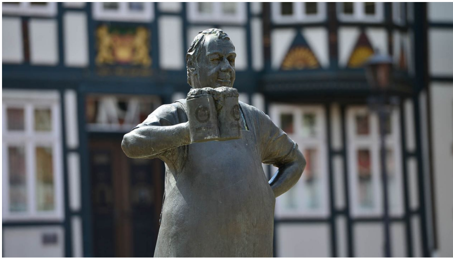
Braumeister in Wittingen