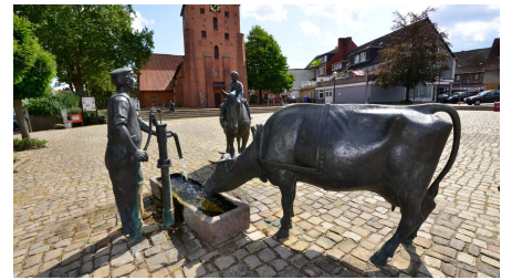
Ackerbürger auf dem Marktplatz