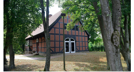
Ecke vom Junkerhof