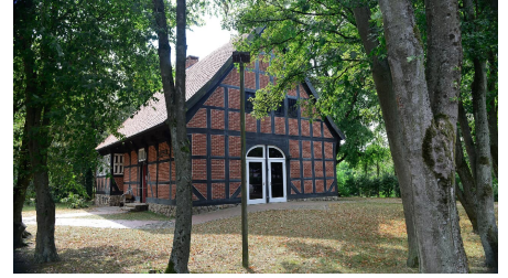
Ecke vom Junkerhof