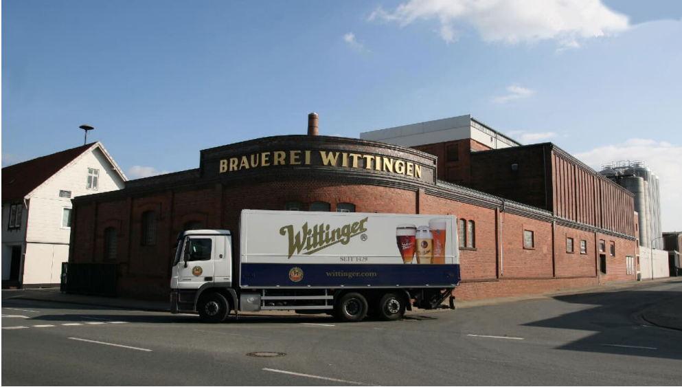
Brauerei Wittingen