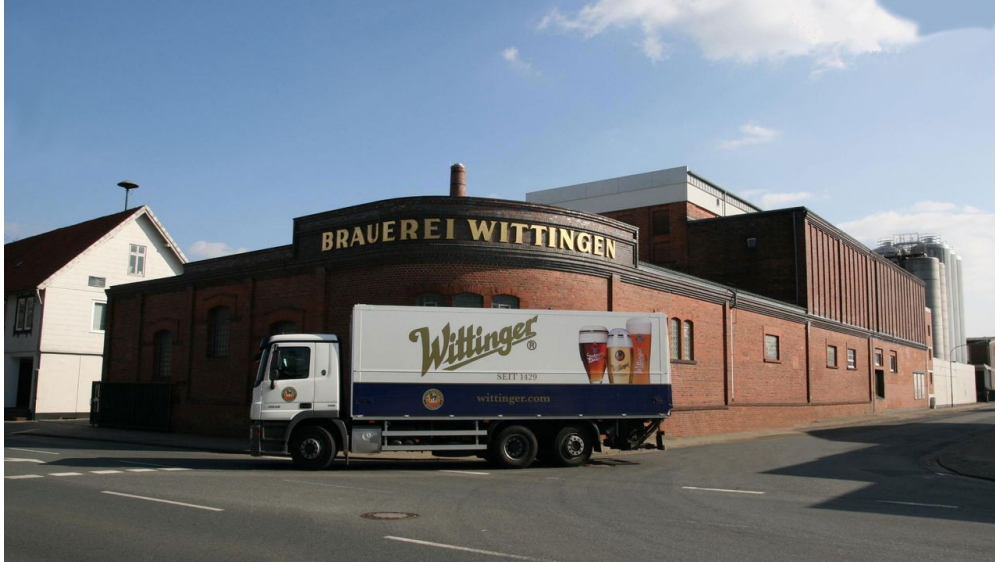
Brauerei Wittingen