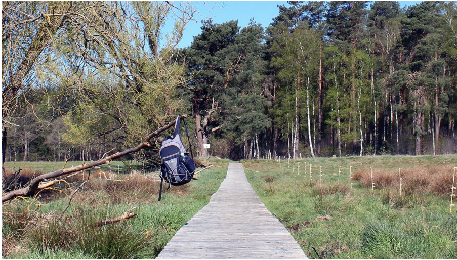
Bohlenweg Postmoor.jpg