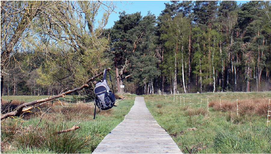
Bohlenweg Postmoor.jpg