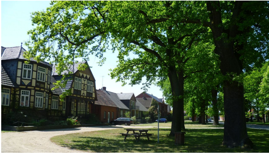
Dorfansicht Zasenbeck