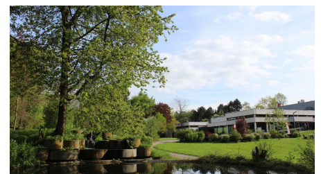
Bad Meinberger Badehaus