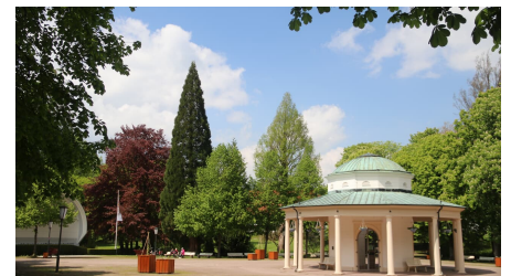
Brunnentempel mit Musikmuschel