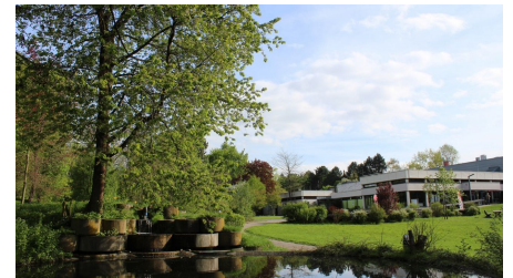
Bad Meinberger Badehaus