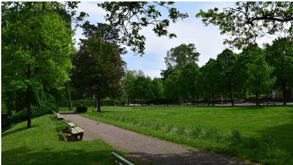
Historischer Kurpark