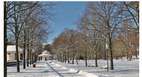
Historischer Kurpark im Winter