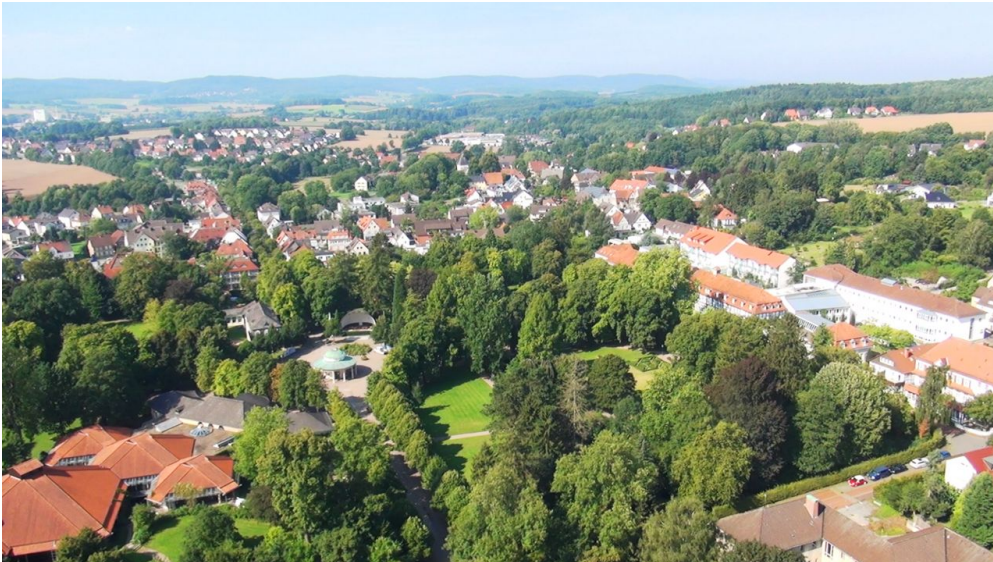
Historischer Kurpark