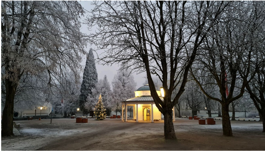
Brunnentempel Weihnachten