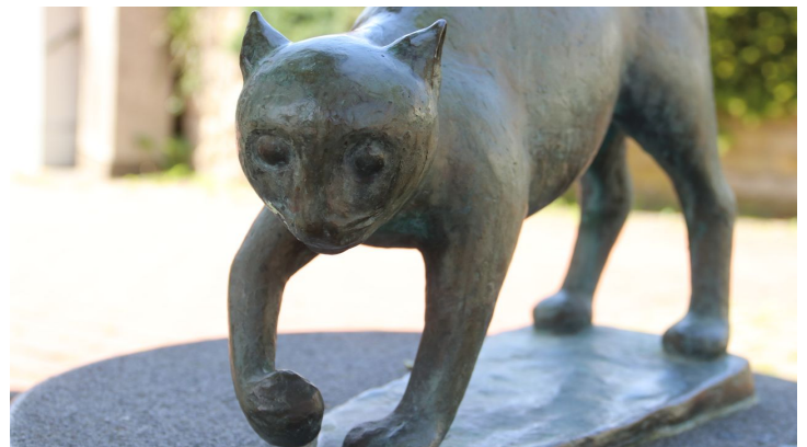
Katzenbrunnen Detail