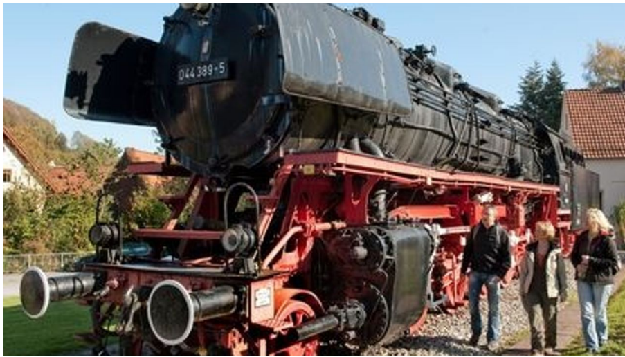
Lok-Denkmal in Altenbeken