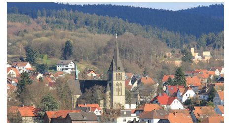
Blick auf Altenbeken