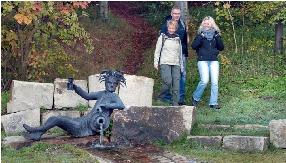
Bollerbornquelle bei Altenbeken