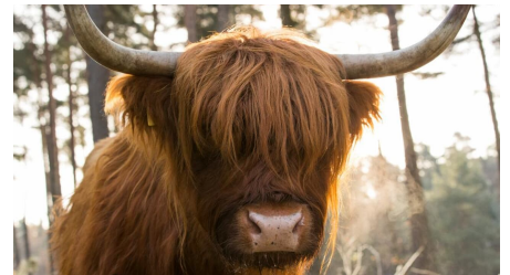
Schottisches Hochlandrind auf eine der zahlreichen Koppeln