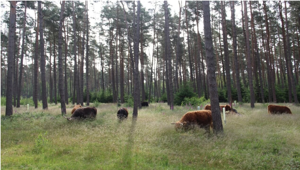
Hochlandrinder im Zuge des Naturschutzgroßprojekts