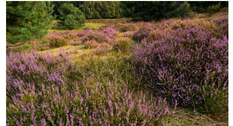
Heidelandschaften entlang des Weges