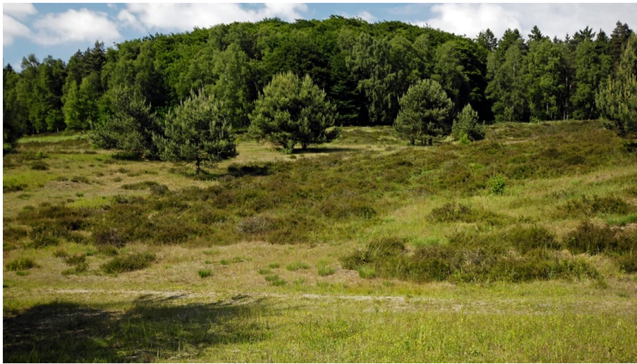
Schöne Ausblicke entlang des Weges