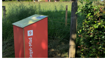
Stele 9 "Zwei Welten" mit Blick in die Landschaft