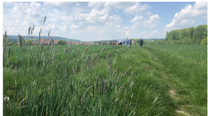
Weitblick in Arrode, Werther (Westf.) - © Teutoburger Wald | pro Wirtschaft GT GmbH