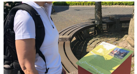
Blick auf Stele 3 "Im Viertel"