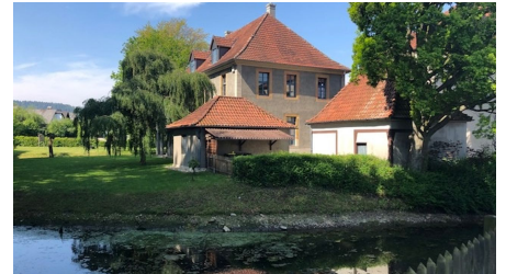
Bürgerbegegnungsstätte Haus Werther