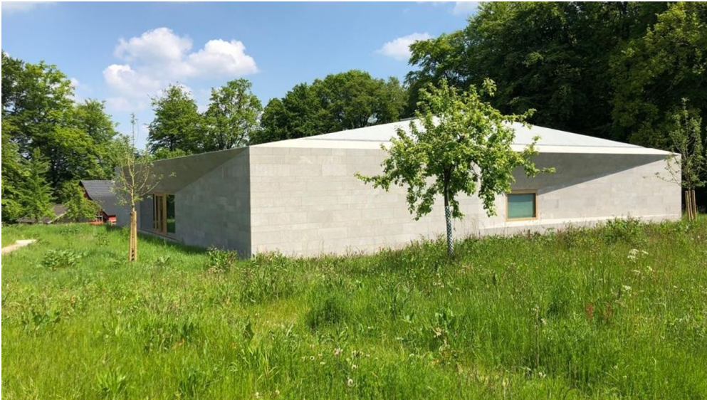
Museum Peter August Böckstiegel