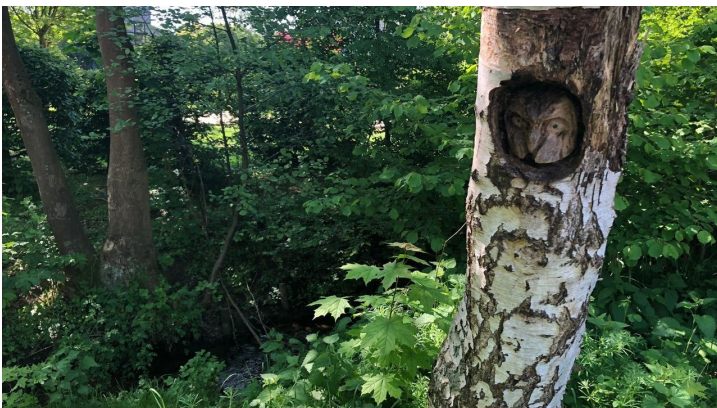
Schwarzbach an der Mühlenwiese, Werther (Westf.)