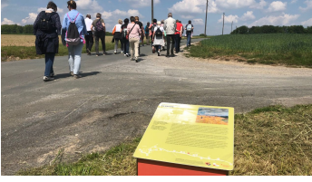
Entlang des Bockstiegel-Pfades