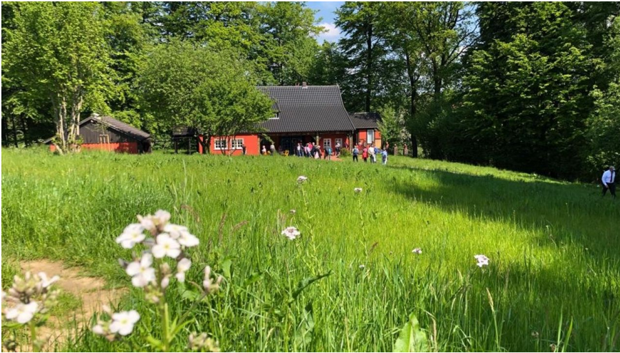
Eltern-/Künstlerhaus des Malers P. A. Böckstiegel