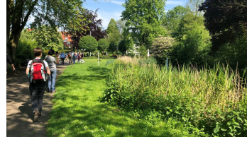
Durch den Stadtpark