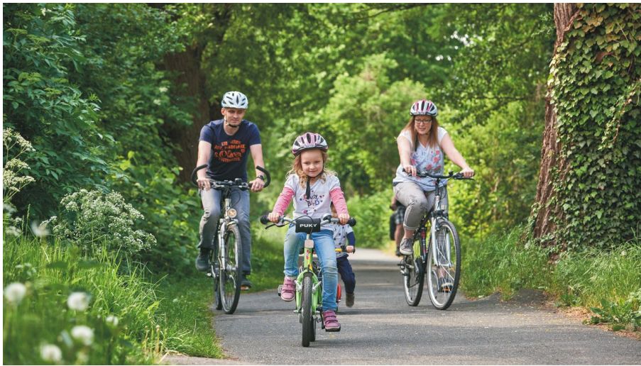
radrevier.ruhr - © Achim Meurer