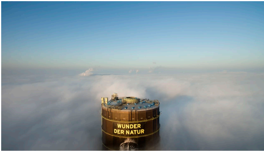
Gasometer Oberhausen