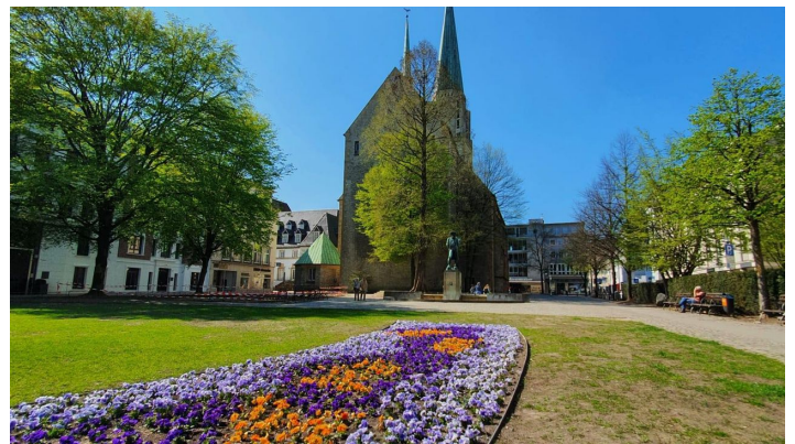
Blick auf die Altstädter Nikolaikirche - © Teutoburger Wald/Bielefeld Marketing GmbH