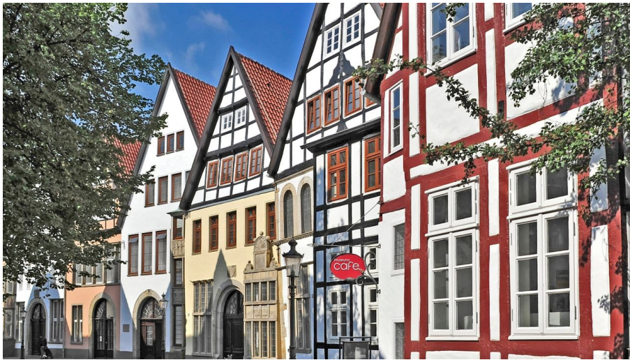
Mindener Museum