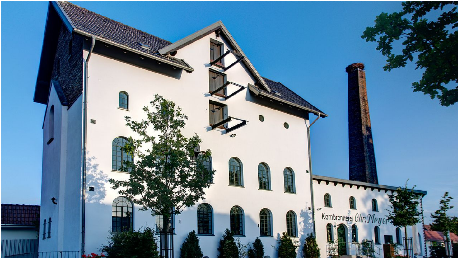
Alte Brennerei Hille_Jens_Kirschbaum_Hille.jpg