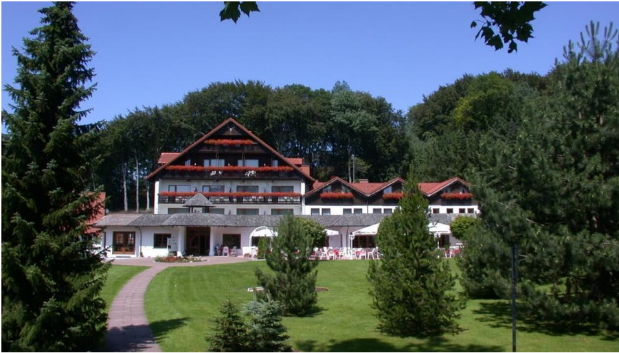
Aussenansicht mit Terrasse im Hotel Mügge am Iberg, Oerlinghausen