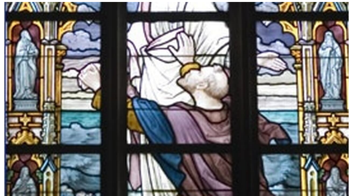
Fenster Obernkirchen