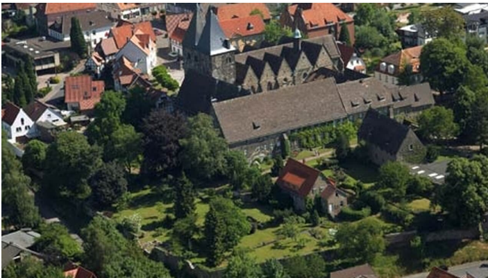
Luftaufnahme Obernkirchen