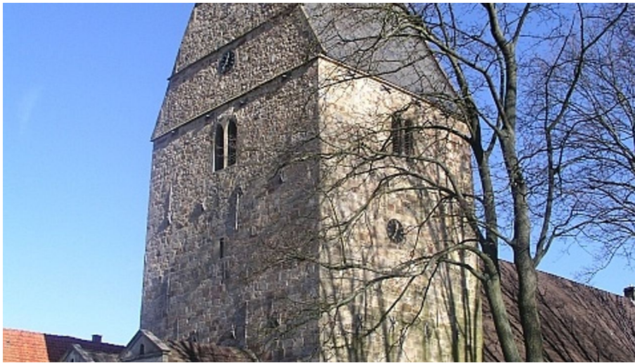
Archidiakonatskirche Apelern