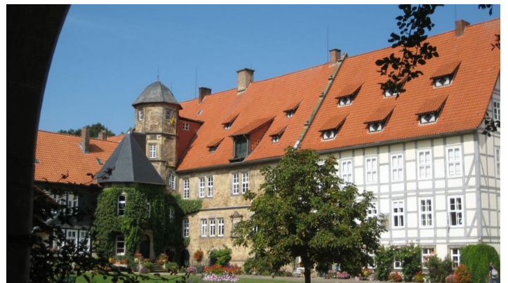
Schloss von Münchhausen