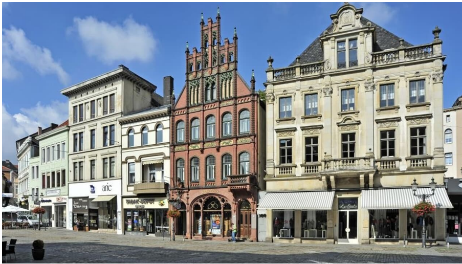
Innenstadt Minden