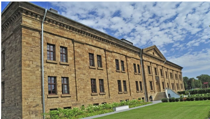
Schinkelbau in Minden - Ehemalige Klinik