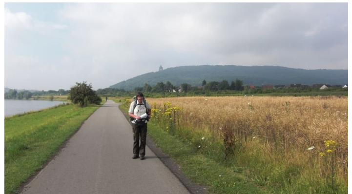
Wanderweg an der Weser