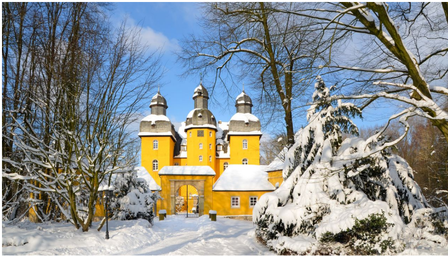
Winterliches Jagdschloss in Schloß Holte-Stukenbrock