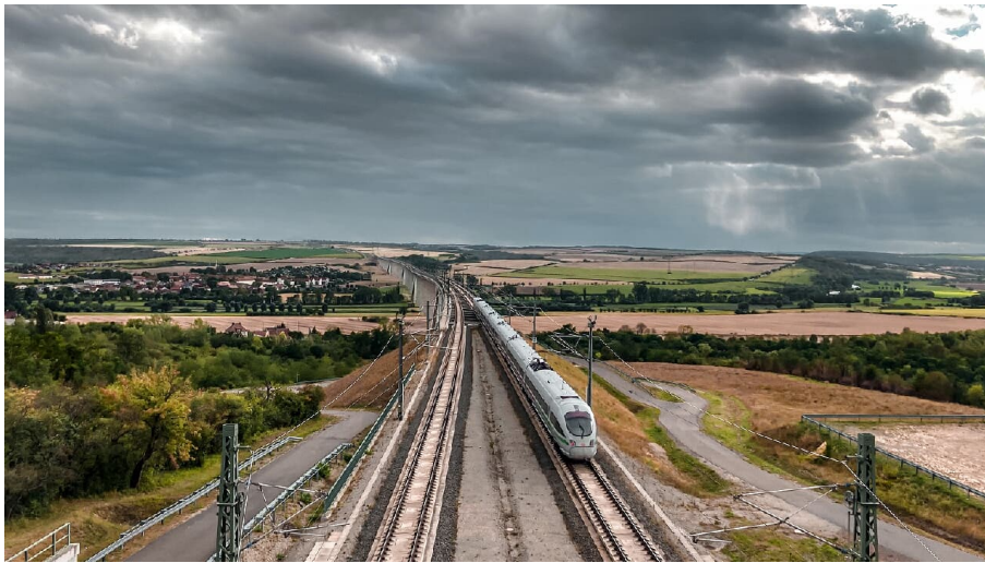
karsdorf_eisenbahnrundweg_ICE_c_kristin_koch - © Places of Travelness