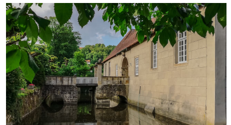
Wasserschloss Haus Mark