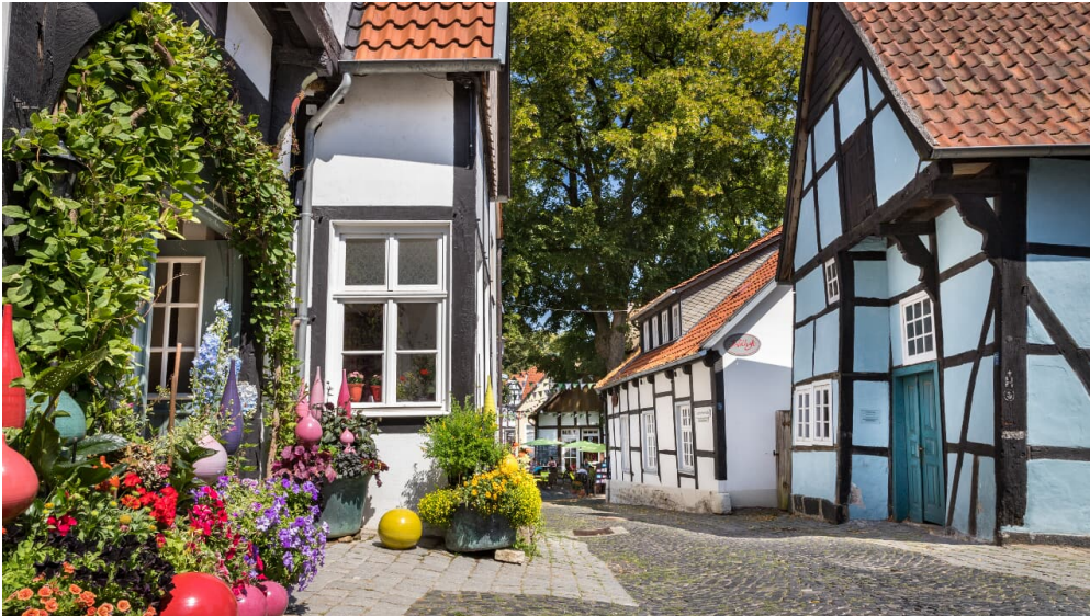
Tecklenburger Altstadt mit "Schiefe Haus"