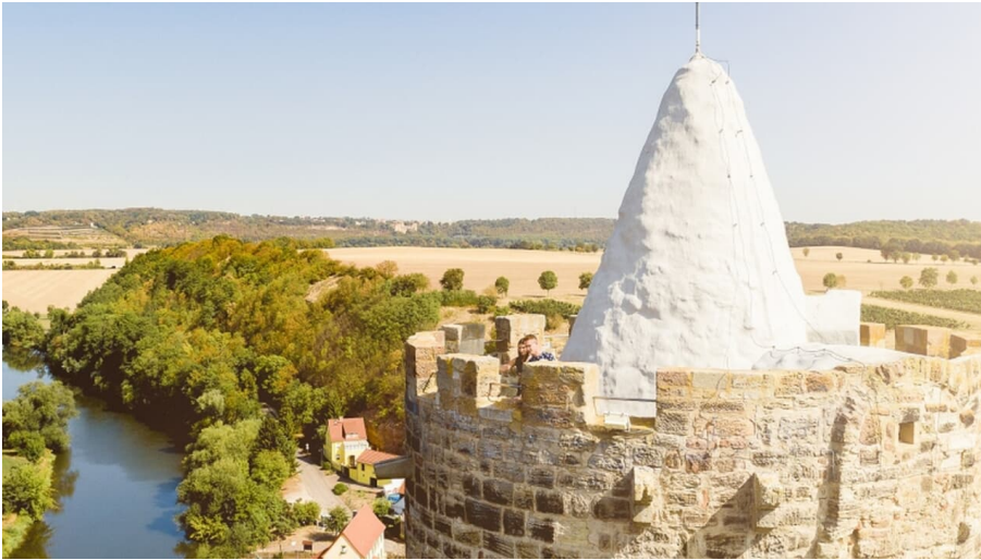
schoenburg - © Transmedial