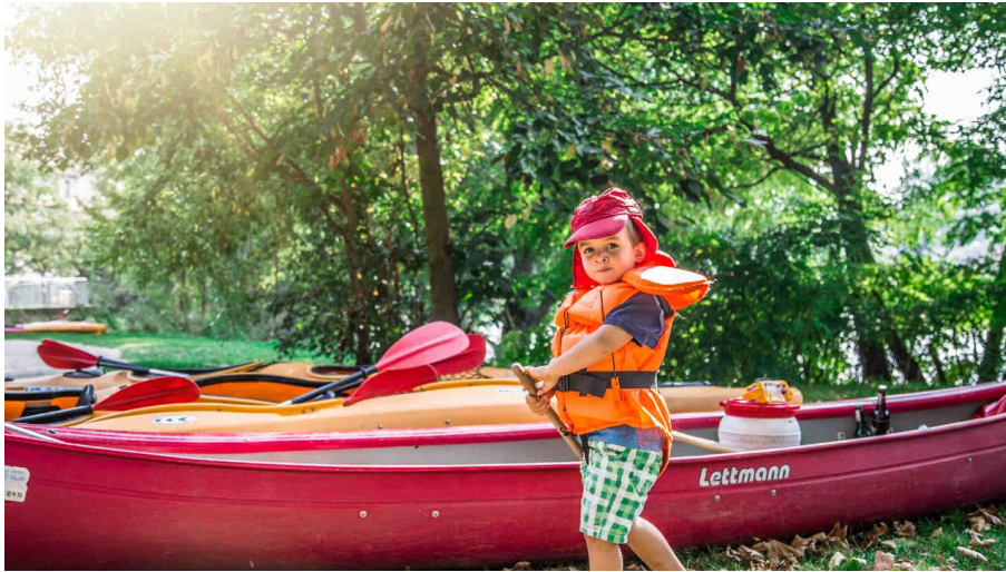
Kind und Kanu