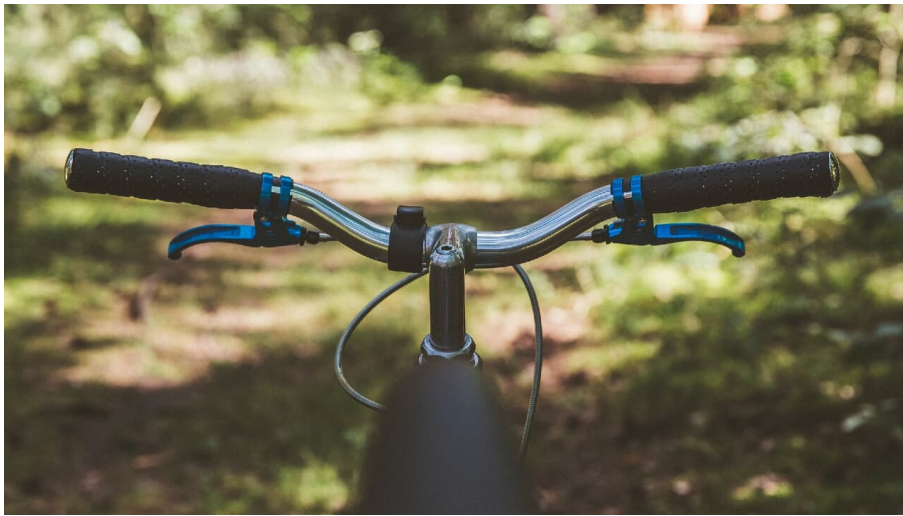
radfahren - © Markus Spiske