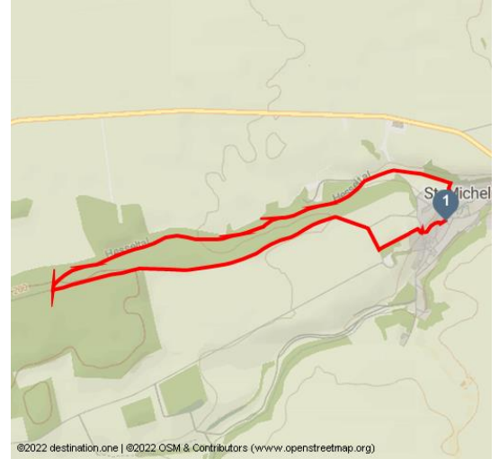
©2022 destination.one | ©2022 OSM & Contributors (www.openstreetmap.org)