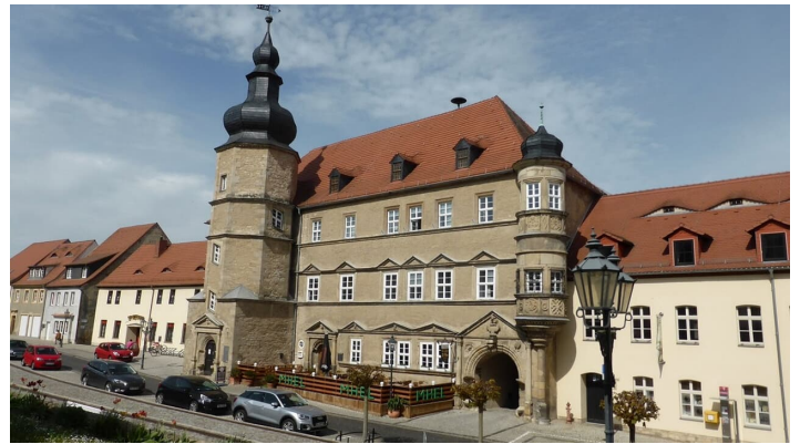
Muecheln - © Saale-Unstrut-Tourismus e.V.