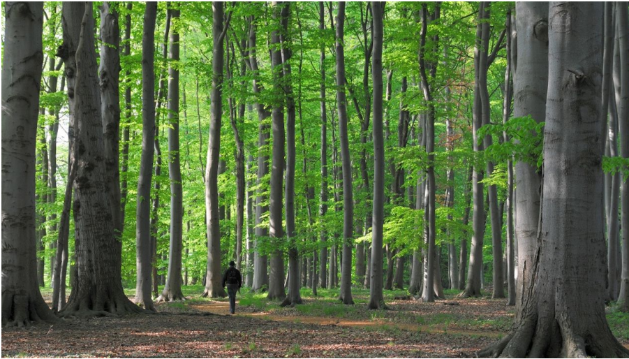
A6 - Wanderweg Holzhauser Berg