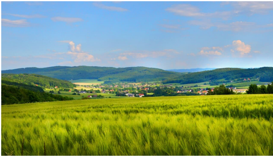
A5 - Wanderweg Börninghausen