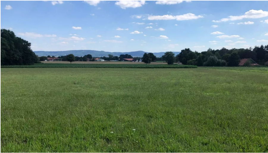
Blick zum Wiehengebirge