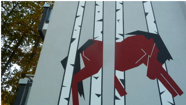
"Der Blaue Reiter" - Schweriner Straße - © Unbekannt