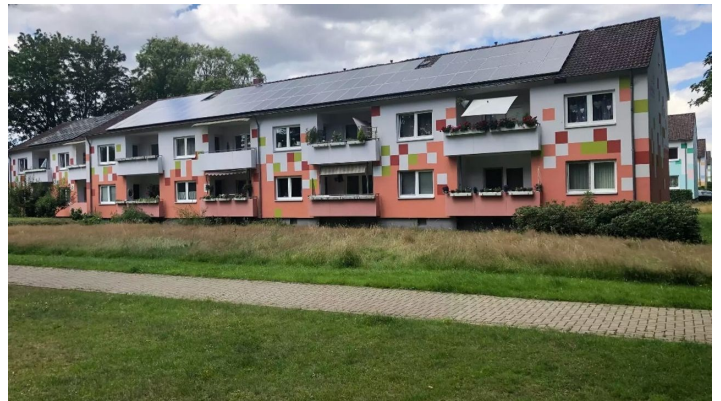
"Pixel" Hedrichsdorf