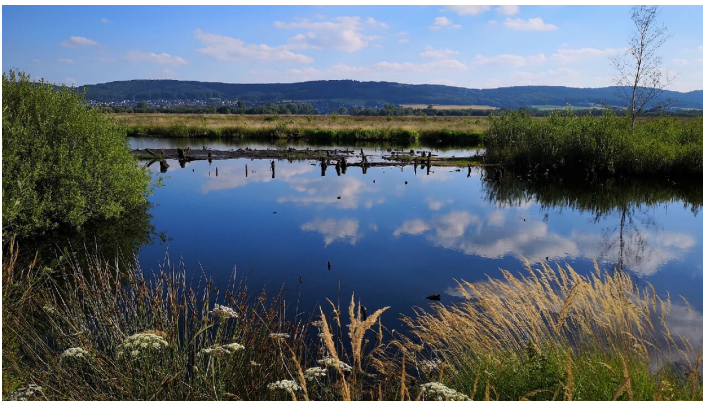
Großes Torfmoor