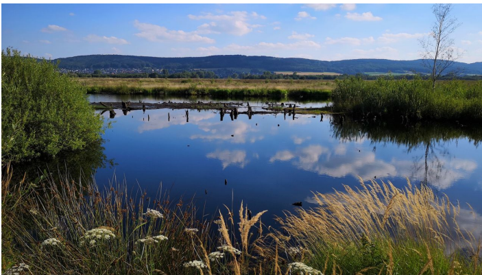
Großes Torfmoor