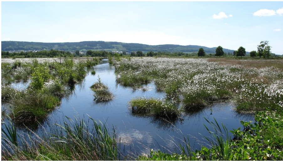
Hiller Moor