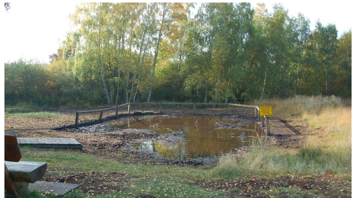
Matschkuhle im Moor