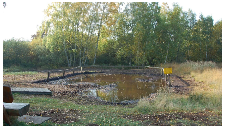
Matschkuhle im Moor