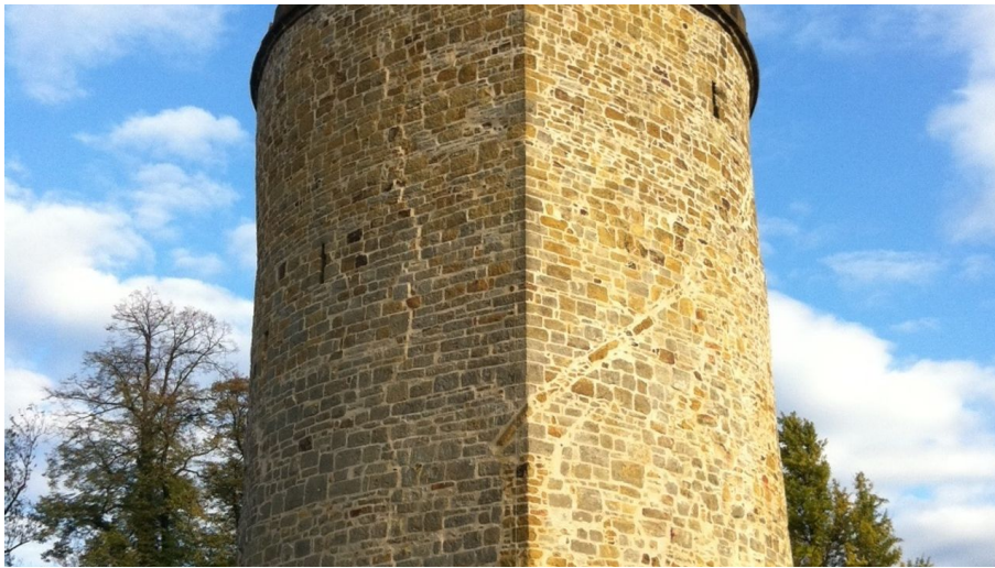
Fotostudio Warias, Stadt Borgholzhausen