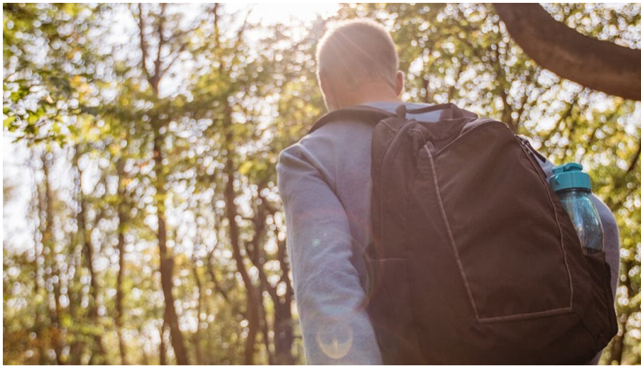
Wandern - © Teutoburger Wald Tourismus - M. Schoberer, Teutoburger Wald Tourismus - M. Schoberer