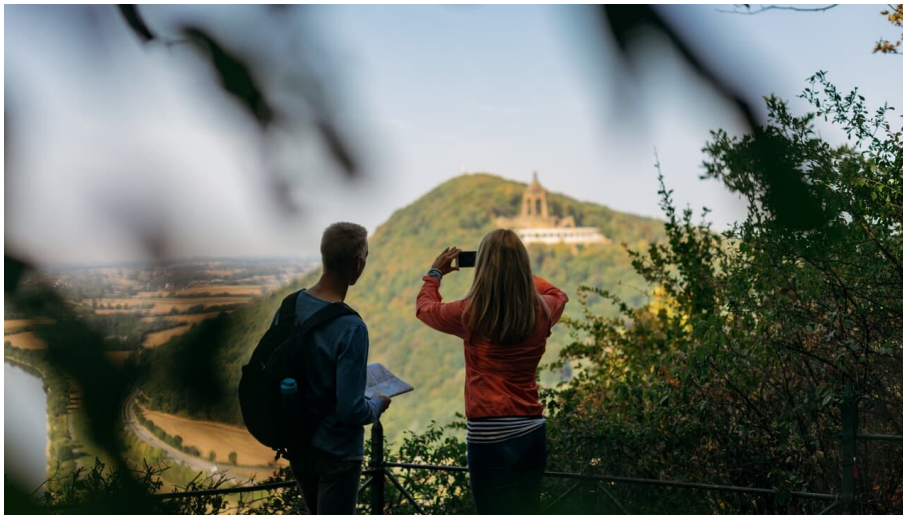
Aussicht auf das Kaiser Wilhelm Denkmal