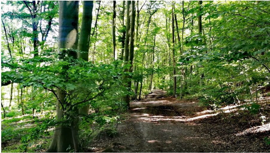
Häverstädter Weg