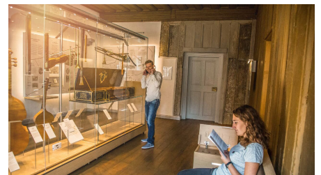
weissenfels_heinrich_sch_tz_haus_dauerausstellung_-_transmedial-1 - © Dauerausstellung