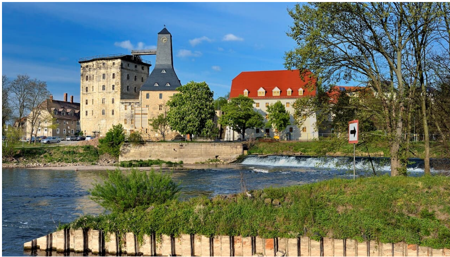
Bad Dürrenberg, Blick auf den Borlachturm und das Salzhaus