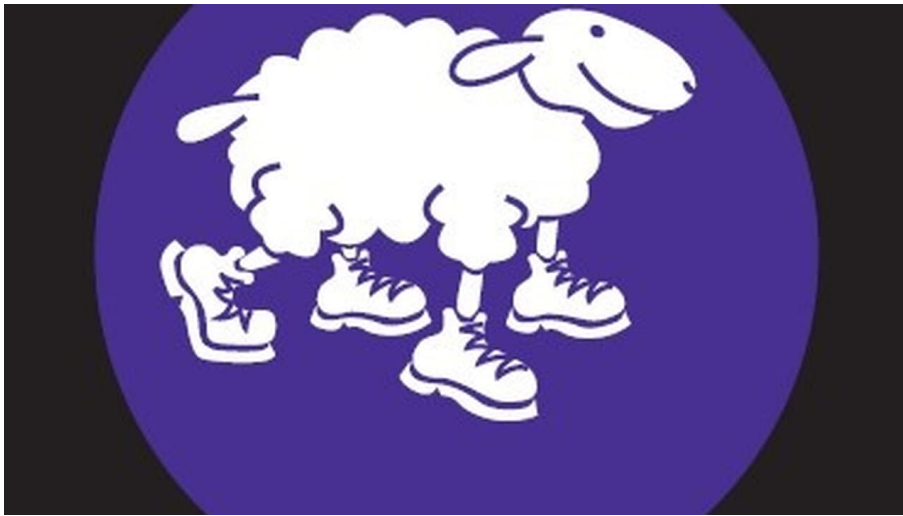
Wegemarkierung Rundtour 4