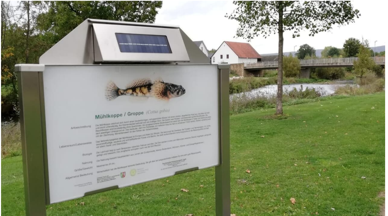
Infotafel Fischlehrpfad