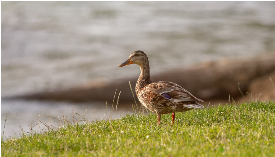
Lebewesen entlang der Emmer