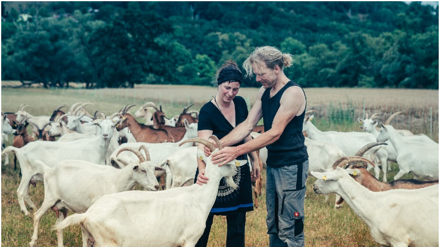
Ziegenhof Schleckweda Besitzer mit Ziegen.jpg