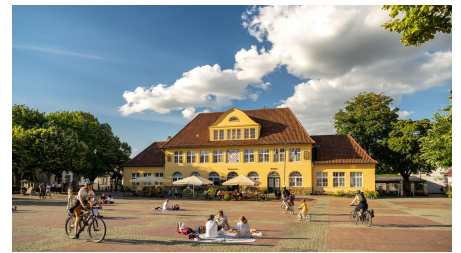
Bielefeld-Siegfriedplatz (Sigg)-Teutoburger-Wald-Tourismus-D-Ketz-087.jpg