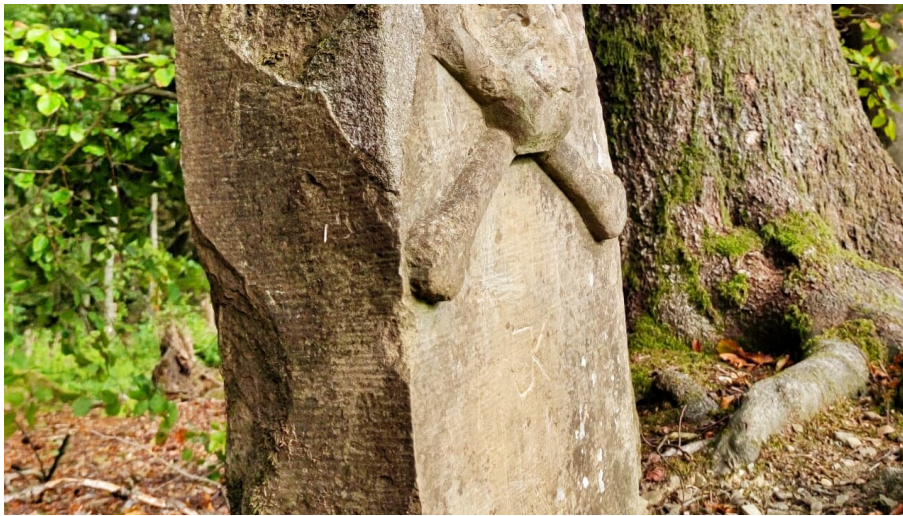
Totenkopfstein