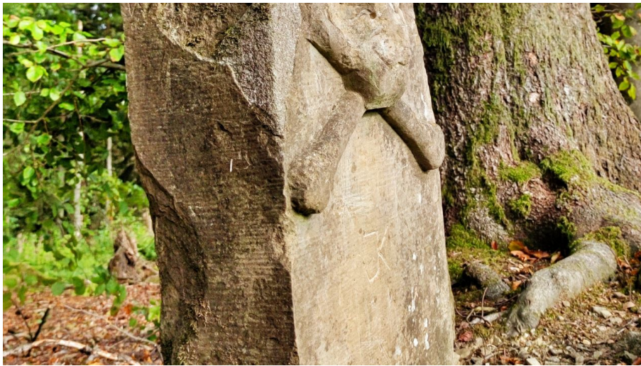
Totenkopfstein