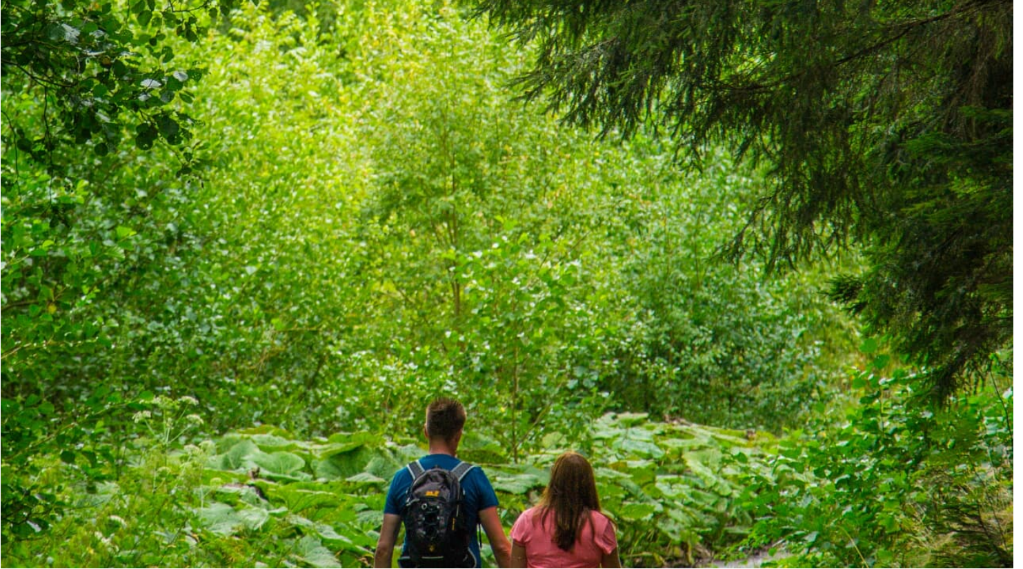
Wandern in Bad Wünnenberg