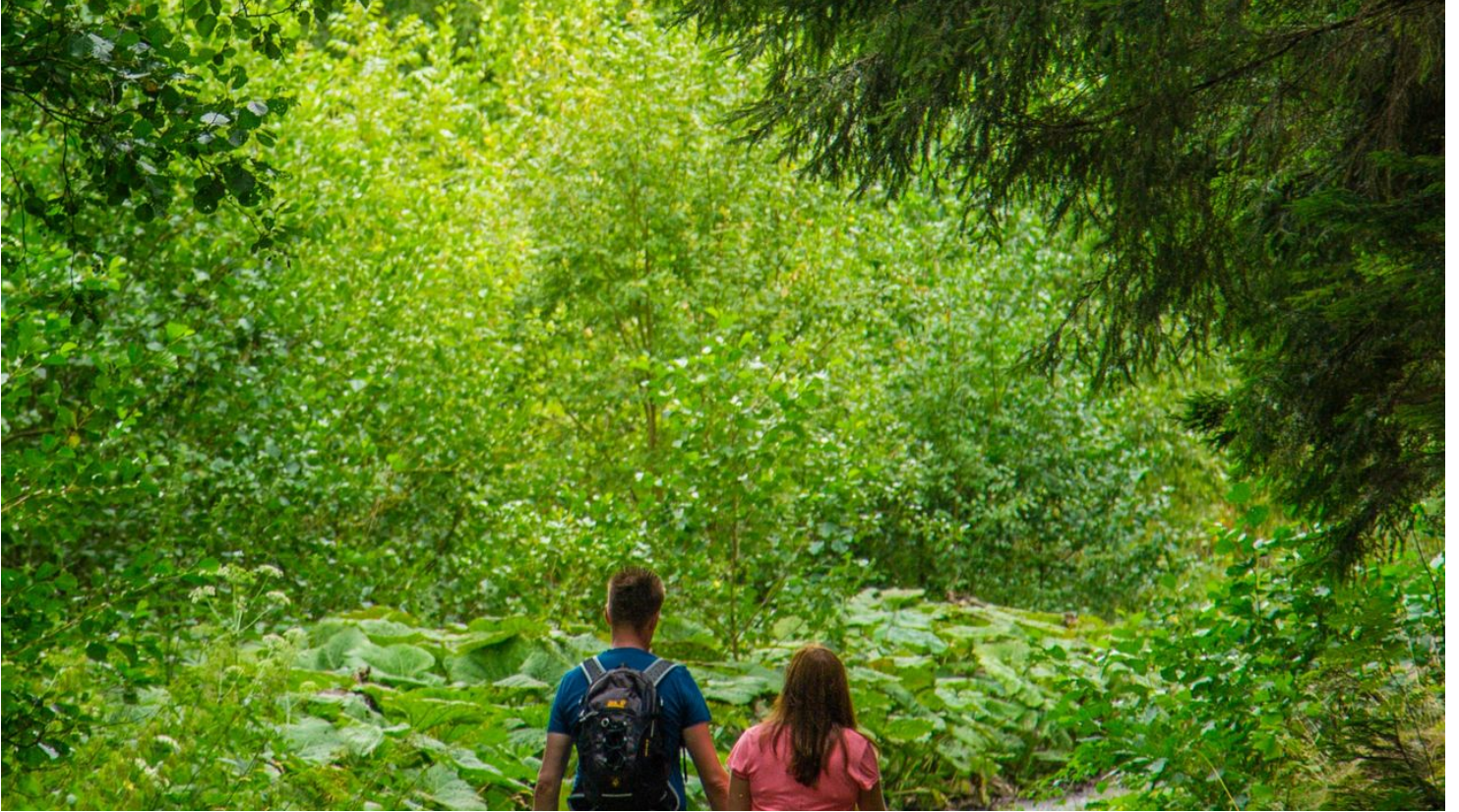
Wandern in Bad Wünnenberg