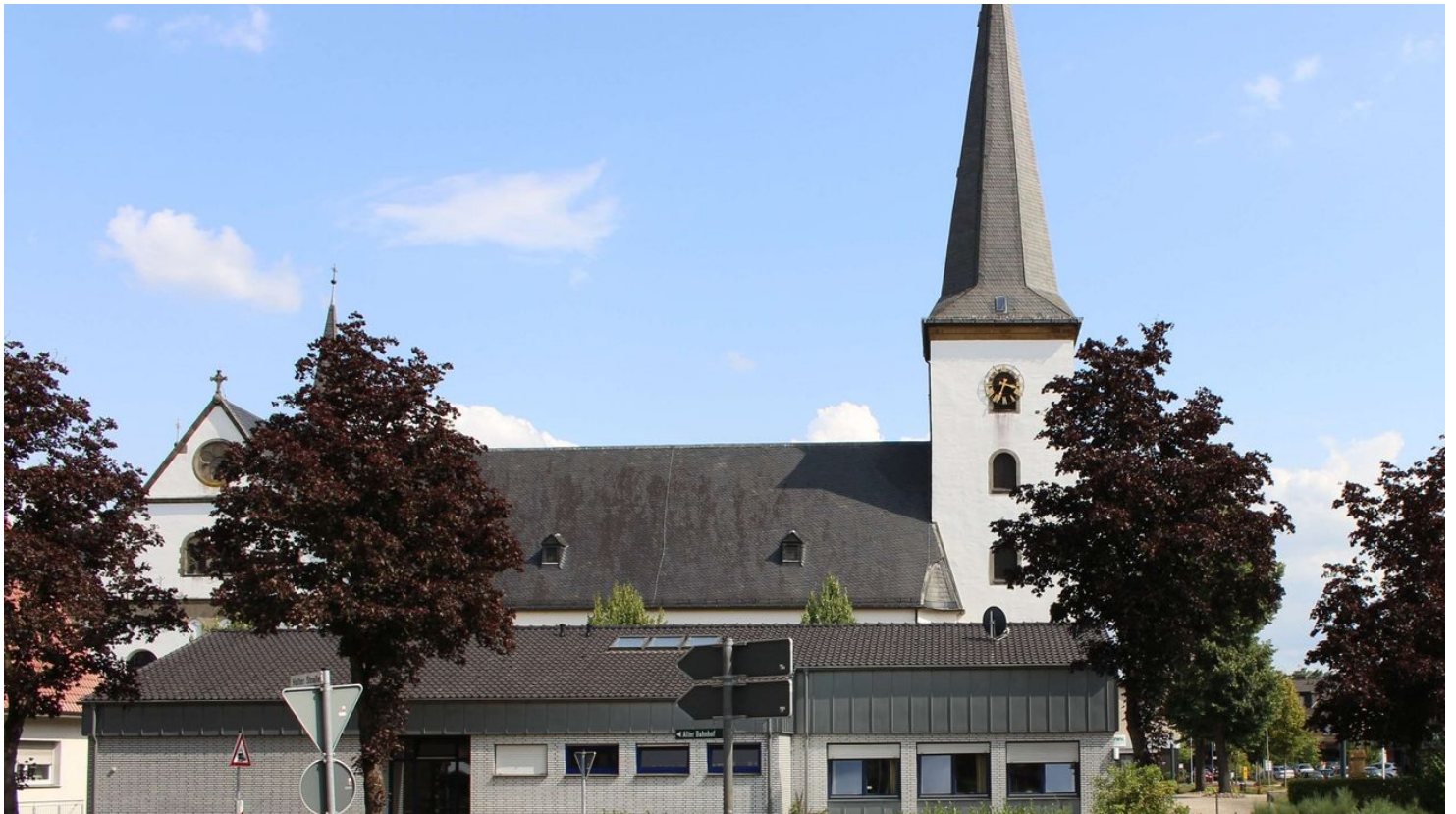
Pfarrkirche St. Maria Immaculata