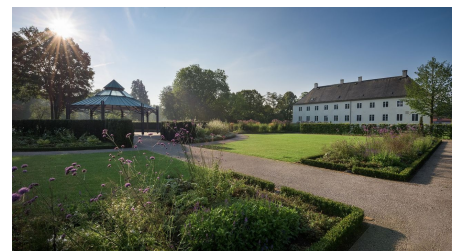
Schloss Benkhausen