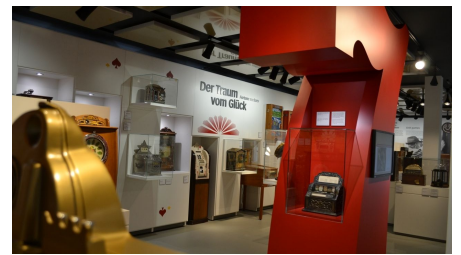
Deutsches Automatenmuseum Espelkamp - Ausstellung "Glück"